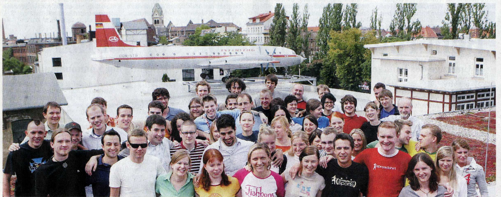
Hoch hinaus will der Internet-Händler Spreadshirt in Plagwitz. Das Unternehmen schafft sich ein neues Hauptquartier für mehr als 160 Mitarbeiter in einer alten Industriehalle an der Naumburger Straße. Natürlich will das recht jugendliche Team – das Durchschnittsalter beträgt 27 – auch dort nicht auf eine große Dachterrasse verzichten.