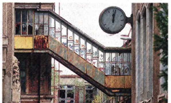
Eine Uhr gegenüber vom Königsbau.