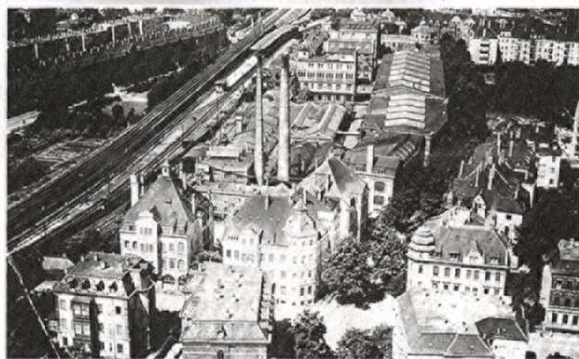
Das Werksgelände zu DDR-Zeiten.