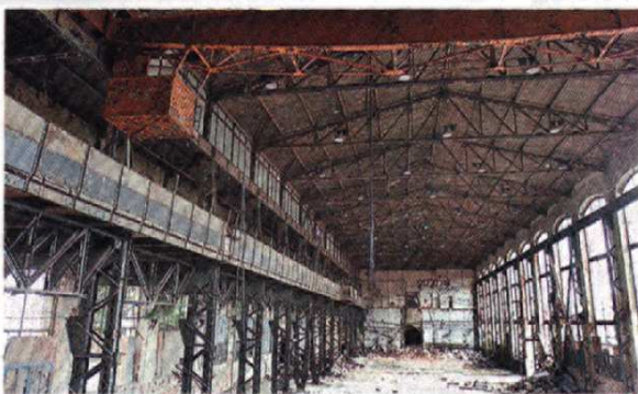
Eine der riesigen Montagehallen.