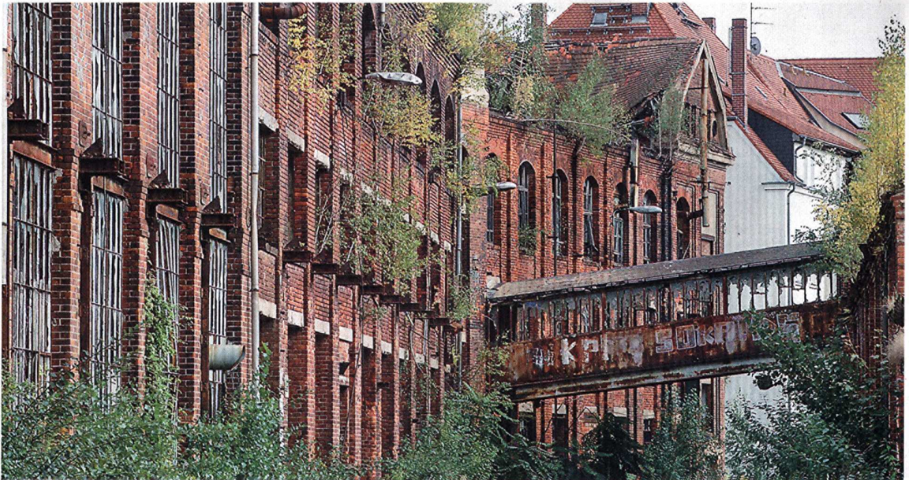
Die Hallen 5 und 6 beherbergten zu Bleicherts Zeiten die Kabelschlosserei und Modelltischlerei. Zwischen vielen Bauten gibt es bis heute überdachte Übergänge.