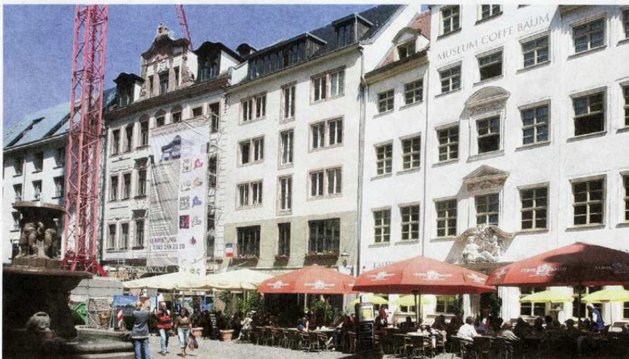
Wo heute Plakat und Kran ins Auge fallen, soll das Kleine Joachimsthal ab 2012 eine Attraktion in der City sein.