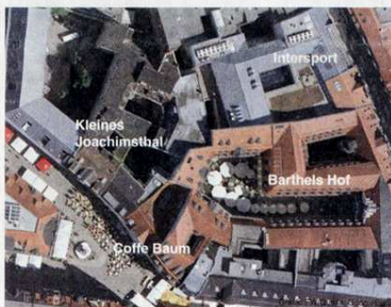
Die Investoren möchten die alte Passage über das Intersport-Haus zur Hainstraße wieder herstellen und den Barthels Hof anbinden.