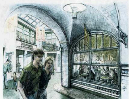
Eine Zeichnung – vor Jahren von Innenarchitekt Holger Schulze für das Büro WVA angefertigt – zeigt das Potenzial der Passage.