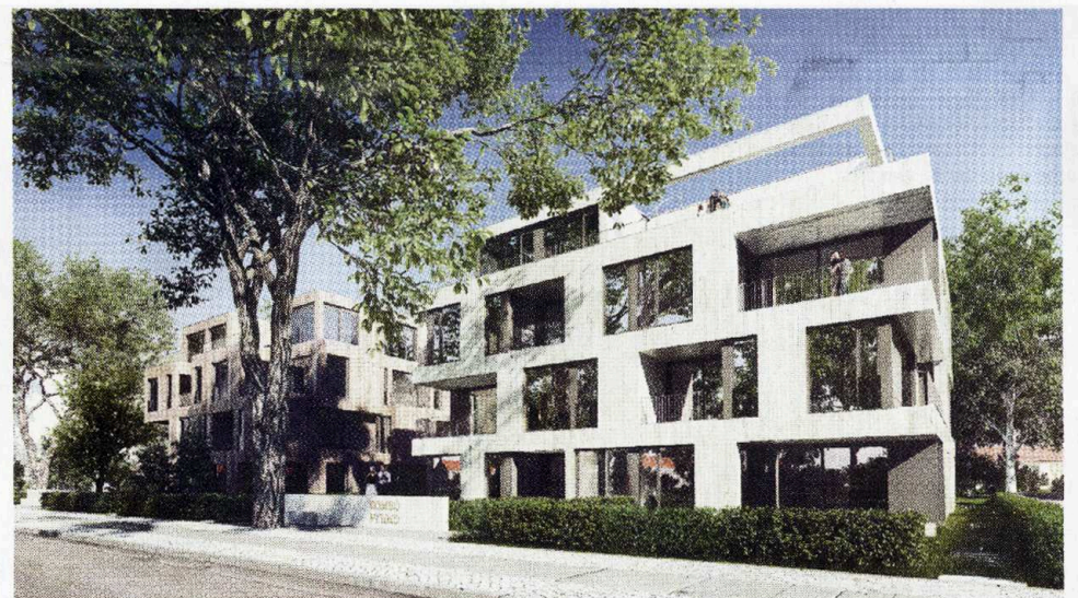
Zwei Gebäude mit einer Seele: das Projekt Romeo & Giulia von der Stofanel Investment im Berliner Westend.