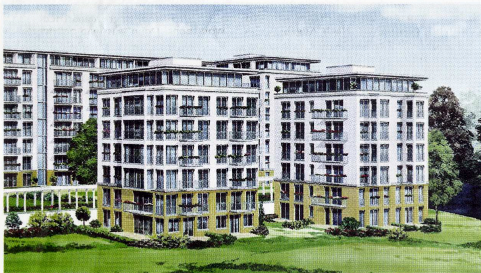
In Wasserlage, unweit vom Schloss Charlottenburg, will die Project-Gruppe rund 100 Eigentumswohnungen bauen.